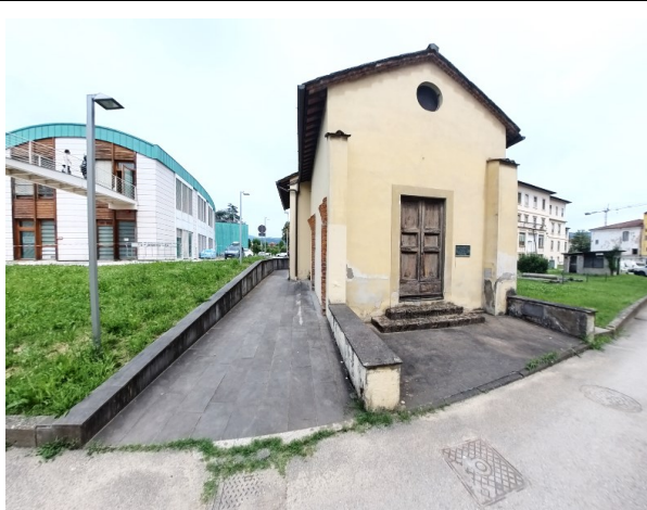
Il percorso del museo si conclude con la visita al piccolo Teatro Anatomico, di forma ovale ad anfiteatro, realizzato tra il 1785 e il 1787 per le lezioni di anatomia della Scuola medico-chirurgica, al quale si accede dal giardino. Alla data della verifica a causa della presenza del cantiere nell'area del Ceppo, per effettuare la visita al Teatro Anatomico è necessario uscire all'esterno del museo e percorrere via delle Pappe, piazza del Carmine e via degli Armeni fino all'ingresso del Padiglione di Emodialisi.