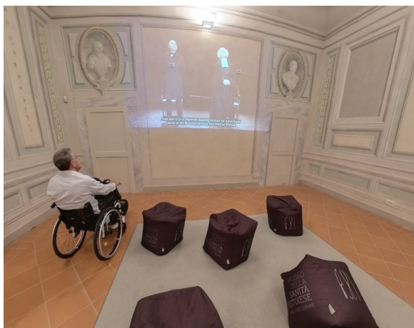
Sala video con immagini suggestive del passato